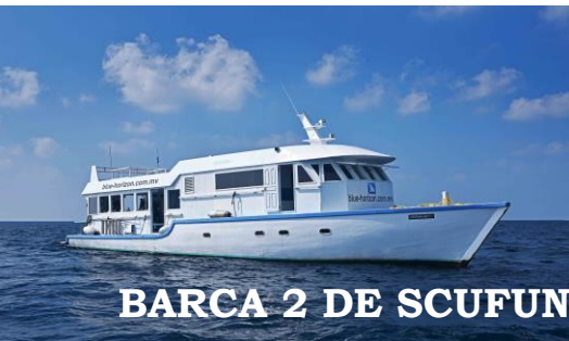
BARCA 2 DE SCUFUNDĂRI „DHONI”