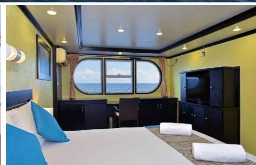
MASTER DELUXE CABIN