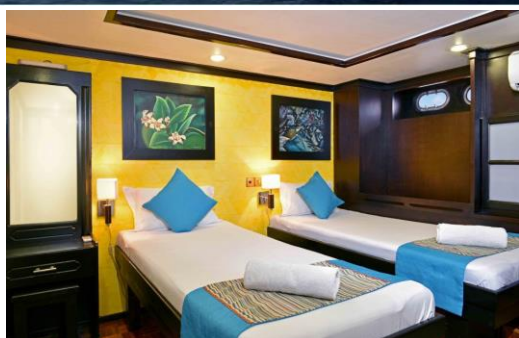
STANDARD DOUBLE CABINS