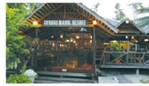
Smart Divers Resort