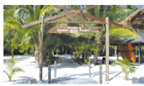
Entrance to Smart Divers Resort