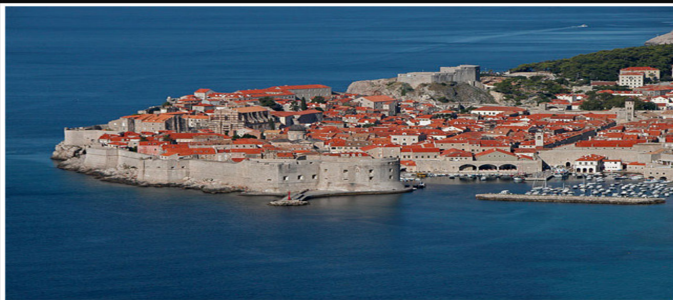
Dubrovnik 2004 Merche

http://www.epidaurum-diving-cavtat.hr/mainindex.htm